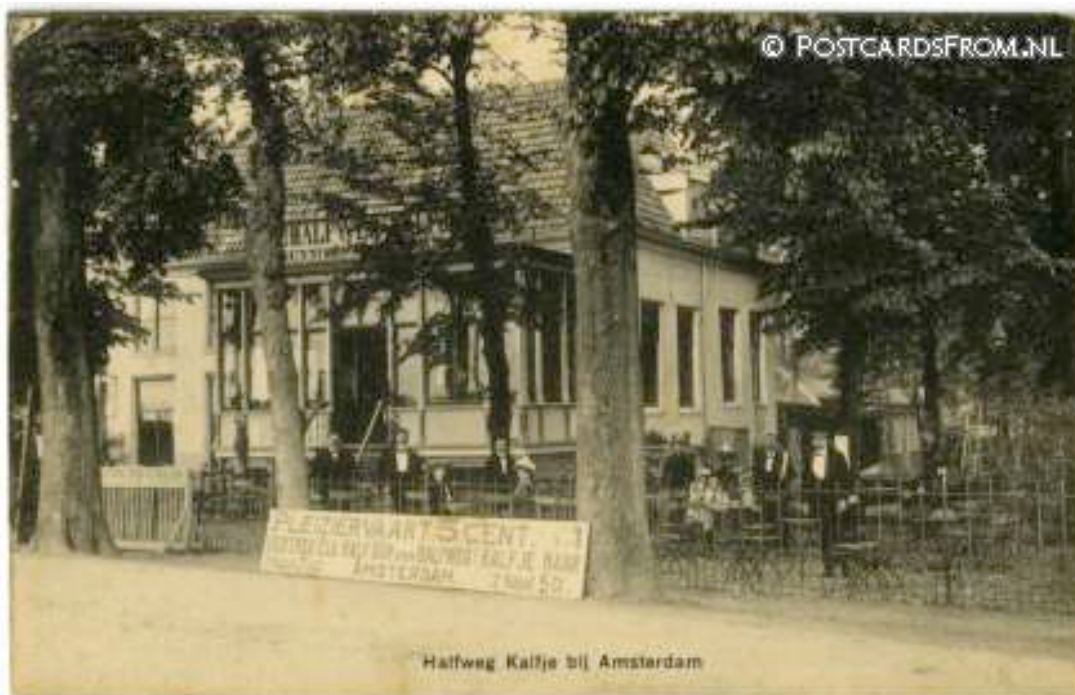
Halfweg Kalije bij Amsterdam