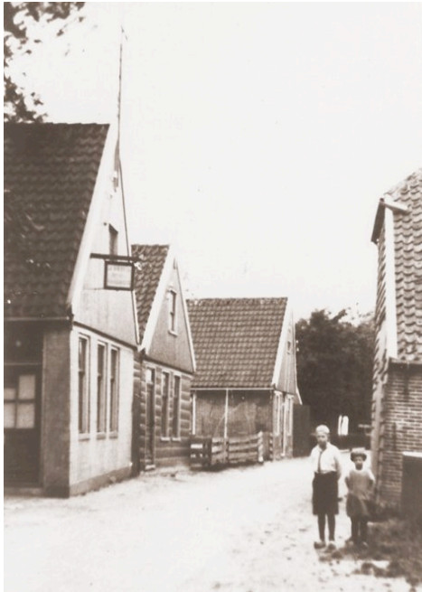
Het uithangbord van bakker J.de Vries

De Buisman bai de zee De Bakker bai de oven Wij wachten hier ter stée De Zeegen God's van boven