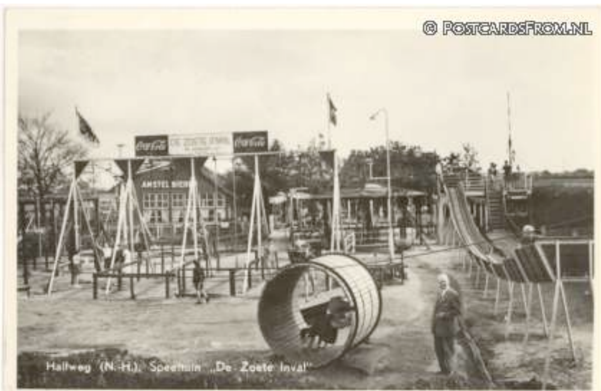
Halfweg (N.H.), Speelhuys „De Zoete Inval“