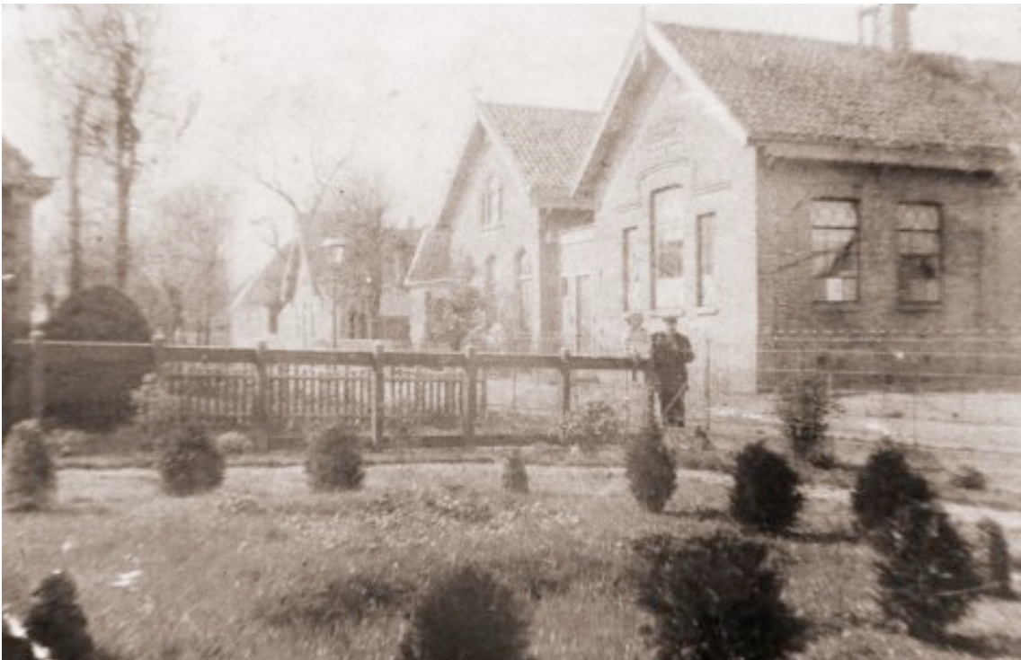
Hier staat de school nog aan de straatkant met de gaslantaarn palen.